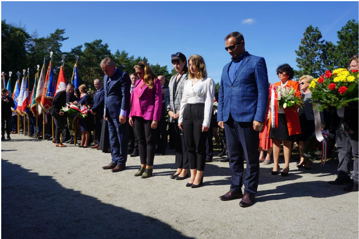
W październiku członkowie Rady odwiedzili Muzeum II Wojny Światowej w Gdańsku.